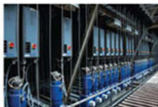
Telem: produtos controlados manualmente

Uma das intervenções mais interessantes da empresa no teatro foi a realização do projeto de iluminação arquitetural. A iluminação da plateia é formada por LEDs, acionados por meio de mesas de controle, uma inovação para os teatros brasileiros. Com ela, o diretor consegue envolver ainda mais o público na dramaticidade do espetáculo.