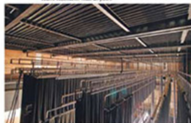
Conexões: seleção turn key garante qualidade das obras Telem