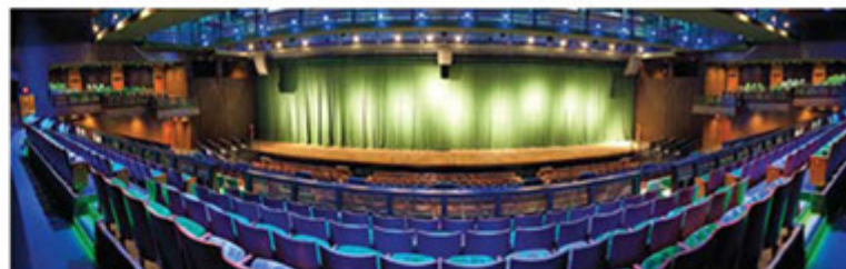
Teatro Riachuelo: vista do palco