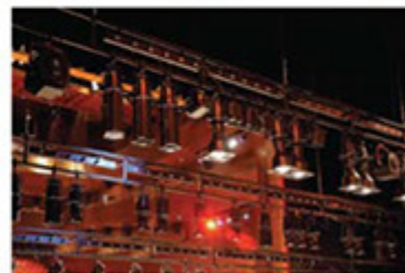
Iluminação cênica: especialidade da Telem