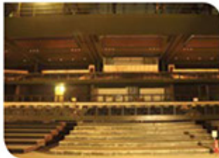
Projeto: Arquitetura: Angelo Cecco e Rafael Perrone

Fornecedores Mestres: Engemetal, Vulcan, ENIL, Arcima, JAG Construções, Boracchi, Stagepar, Telem, Sones/Isabaci, Riocin, HarmanCBL, Griflex, Elio Esquadrias, Metro Office Corporate, Firenze, SLS Audio e Vídeo, M&T Marcenaria, Embraemil, Trata Acústica, Aço Brasil, Romer Vidros, San Vidros, Marmore Ltda, Tramontina.